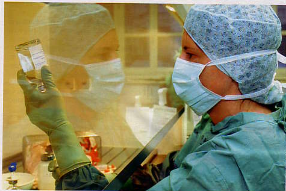
Forschung mit Zytostatika: „Es gab und gibt keine Erfolge“

Seit Jahrzehnten bringen Arzneimittelhersteller immer neue Zytostatika auf den Markt; in den siebziger Jahren waren 5, in den Neunzigern dagegen bereits rund 25 Mittel zugelassen. „Wenn da jedes Mal ein